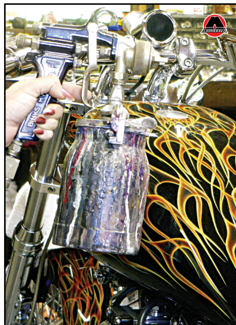
Мой первый новый краскопульт 18 лет спустя.