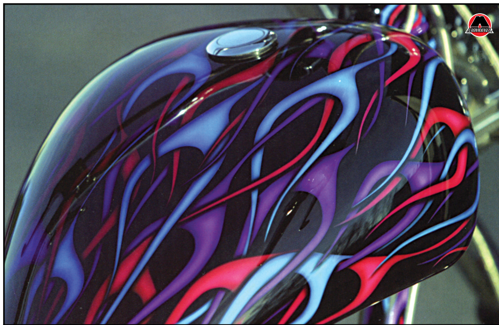
Три слоя языков пламени, нанесенных аэрографом.

слоя выбирают прозрачную краску, например межслоевое средство SG-100 компании House of Kolor. Это средство не нуждается в шлифовке перед нанесением аэрографии. Но есть одно условие: работы необходимо выполнить в течение 12 часов после нанесения межслоевого средства, в противном случае поверхность придется шлифовать, иначе аэрография не будет ложиться также хорошо, как должна была. Краски различных видов и производителей имеют различные рекомендации относительно промежутка времени, в течение которого краску необходимо покрыть