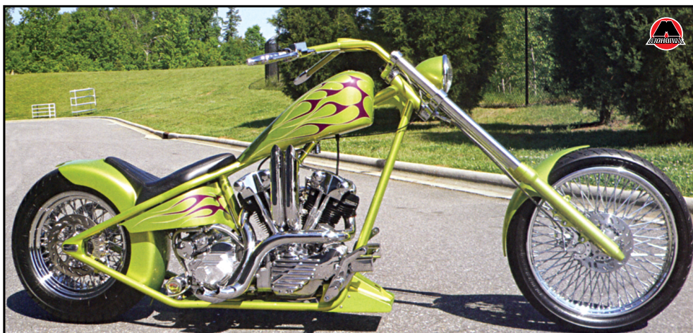
Краска «Кэнди» UK-02 Lime Gold компании House of Kolor, нанесенная на базовый слой краски BC-02 Silver Shimron, придает этому мотоциклу Knucklehead действительно отличный вид.

Наиболее эффективным и безопасным способом создания новых цветов является пробная покраска небольших деталей, которые всегда должны быть под рукой. Некоторые художники используют карточки черного цвета или планшеты для пробы цвета. Однако я считаю, что цвет выглядит совершенно по-другому на округлой поверхности деталей мотоцикла. Цвет, который выглядит ярким на плоской поверхно-