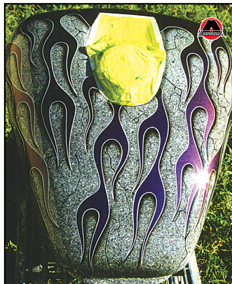
Базовый слой с гранитным эффектом под языками пламени.