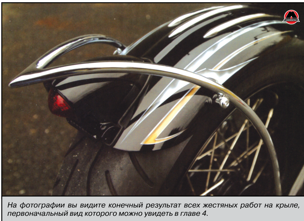
На фотографии вы видите конечный результат всех жестяных работ на крыле, первоначальный вид которого можно увидеть в главе 4.

Экспериментируйте с различными настройками давления воздуха. Выберите технику перемещения краскопульта по окрашиваемой поверхности и привыкните к ней. Обратите внимание на