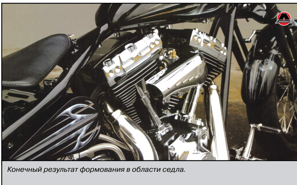
Конечный результат формования в области седла.

Обязательно узнайте, в течение какого периода времени можно использовать продукт до того, как он начнет затвердевать. Двухкомпонентные грунтовки обычно необходимо использо-