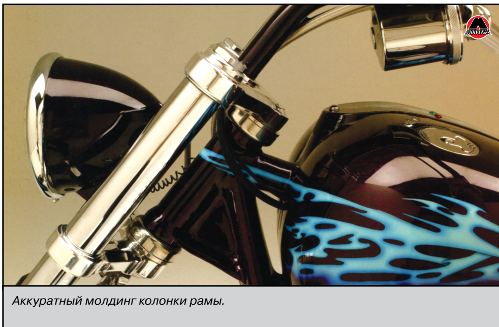
Аккуратный молдинг колонки рамы.

Шесть лет спустя я предприняла еще одну попытку. Я была старше и мудрее, небольшой участок рамы отнял у меня много времени, однако, в конце концов, мне удалось это сделать. Все вышло просто чудесно, после этого я не боялась наносить герметик на раму мотоцикла.